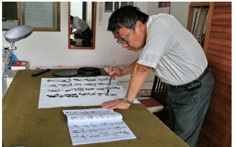
作者在家勤練書法神情