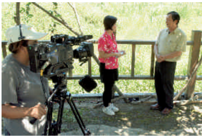
林鄉長與節目主持人暢談國姓之美

國姓之美，源自於其低度開發，在繁雜的工業社會中，人們所追求的是最簡單的美與最純樸的聲音，而國姓正是如此令人醉心之處。