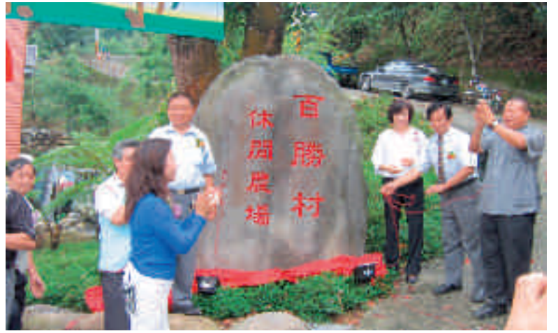
百勝村休閒農場開園

百勝村休閒農場民宿有六間寬敞的套房，每個窗戶可以看到龍盤虎踞的山巒，連綿起伏，雲霧飄