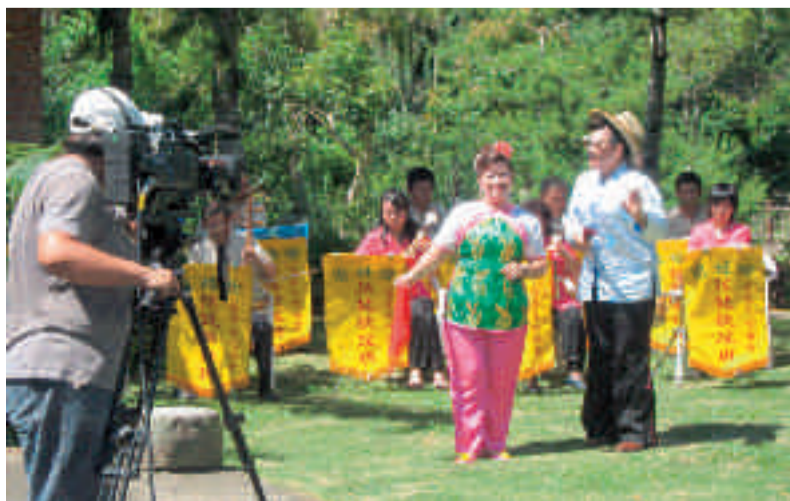
國姓客家弦鼓歌謠班學員錄影情形