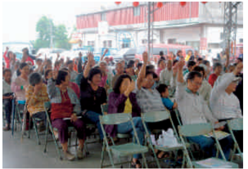
鄉民熱烈參與村民大會

古人嘗言：居廟堂之高，則思其民。瞭解民意、深入民瘼，必須要下鄉傾聽人民的聲音。目前因地方政府經費拮据，南投縣召開村民大會之鄉鎮大不如前，甚有鄉鎮已不予召開。本鄉召開村數乃居全縣之前茅，希以此廣聽民意，並以為政府與民眾溝通之橋樑。