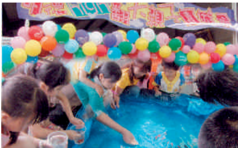
明德幼兒園親子遊園會撈魚活動

看到孩子們和家長們如此認真、投入的參與，實在令人感動，希望在親師合作及精心設計的活動參與中，讓每位明德學子都成為知足、感恩、快樂的小天使。