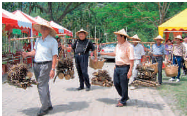
長官們體驗客家人挑重擔走長路的艱辛

客。會場邀請王顯正、沈政瑩、曾阿南三位書畫大師現場揮毫，吸引大批民眾排隊請求墨寶。國姓鄉休閒農業聯盟擺設數十個攤位，陳列國姓鄉農特產品供遊客選購。五月十一日在地球村休閒農場由策略聯盟主辦，為慶祝母親節，「媽媽心子女情，永結桐心憶童年」農村生活體驗活動。國姓鄉多處種植苦茶，現場再壓製純正苦茶油，因貨真價實，供不應求。白甘蔗壓榨成甘蔗汁，經六小時以上的熬製，煉製的純正黑糖，像極麥芽糖沾著餅乾甘甜而