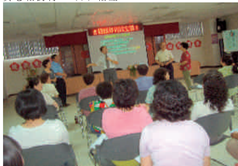
楊進昇教授演講情形

※鄉農會辦理中式飲食加工證照班，凡年滿15歲至55歲實際從事農業生產之農保被保險人或農民配偶，農會會員均可報名參加，即日起至6月20日下午3時截止，詳情請洽推廣股049-2721879。