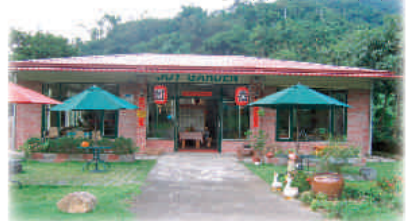
環境幽雅的喬園民宿

蔡太太拿手的客家料理、洛神餐、艾草粿名聞遐邇。偶來幾位退休好友相聚喬園，閒話家常，享受山林之樂。樂立期盼有緣人常來南港村，體驗大自然的美及身心靈的饗宴。