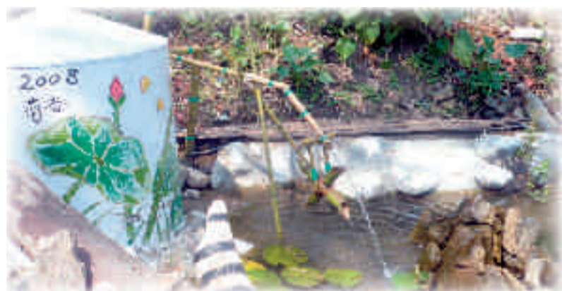
大旗社區的創意生態池

轉，旗子用原木彩繪荷花引蝶入園來；蓋水塔於生態池邊，許理事將它彩繪荷香，美化池畔，使大旗社區景觀改變，過往人群居民賞心悅目。