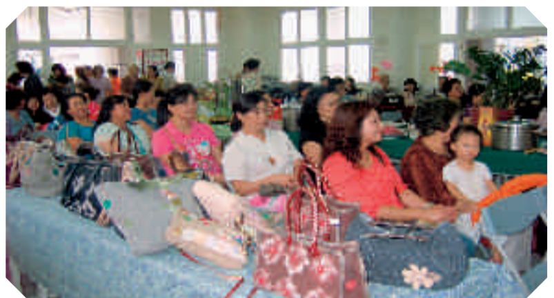
拼布作品玲瓏滿目

縫路，針線走過不留下痕跡，各個都是獨一無二的作品，將可成為收藏家的珍藏。此次參加拼布班有35位學員參與，完全免學費，免材料費。鄉長夫人、李議員夫人到場致意，希望學過這些專長，共同研發，盼能集資製作更多的成品，共同展售，創造商機增進收益。