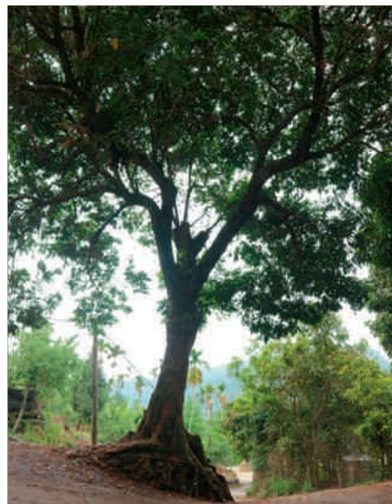
位於棉仔園產業道路轉彎處的龍眼樹。