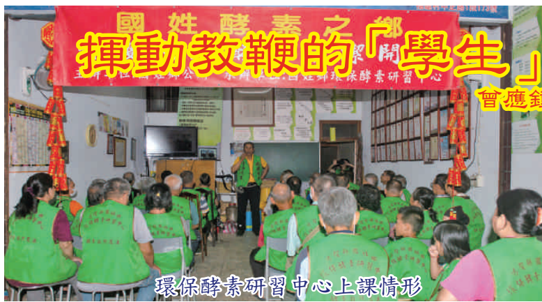
環保酵素研習中心上課情形