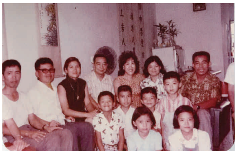
江蘇省銅山柳新莊鄉親五十年代例假日多歡聚在五叔家敘舊。