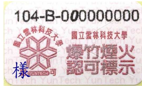
一般爆竹煙火認可標示

(三) 施放場所規定:下列地點不得施放爆竹煙火，違反者得處新臺幣 6 萬~30 萬元罰鍰。