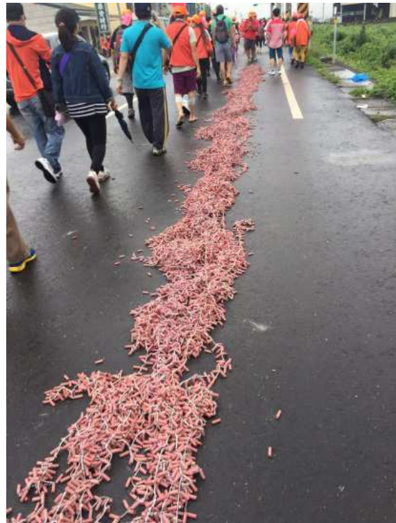
圖、串接或堆疊等錯誤燃放爆竹行為

3. 民眾購買一般爆竹煙火時，應選購貼有認可標示之合格產品，並確認產品上是否具有使用說明、廠商資料及主要成分等相關資訊，以確保安全，認可標示範例如下所示。持有未附加認可標示之爆竹煙火，達中央主管機關所定管制量 5 分之 1，處新臺幣 3 千~1 萬 5 千元罰鍰。