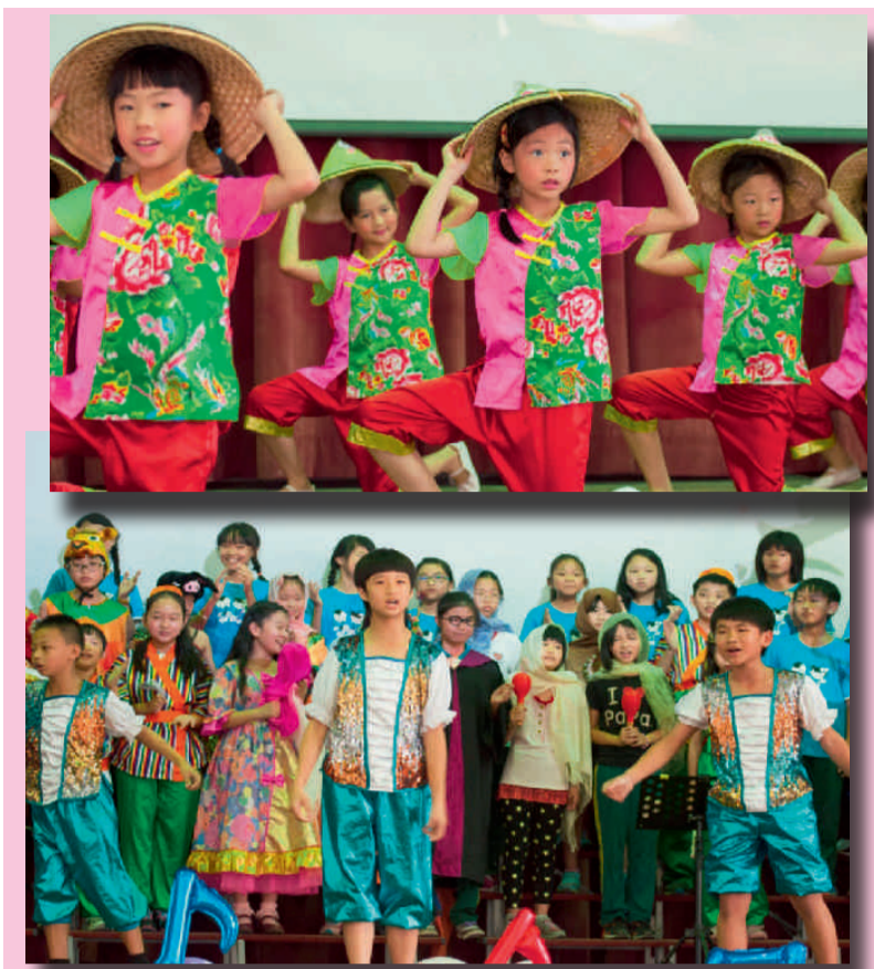
上圖客家歌謠 下圖音樂舞台劇

最後，由5位學生與全校老師上台帶領全校300位學生與家長一起跳「歡樂歌」，在歡樂活潑的氣氛中結束了一天的活動。「教育就是給孩子機會與舞台」，國姓國小音樂魔法節提供了最好的教育典範。