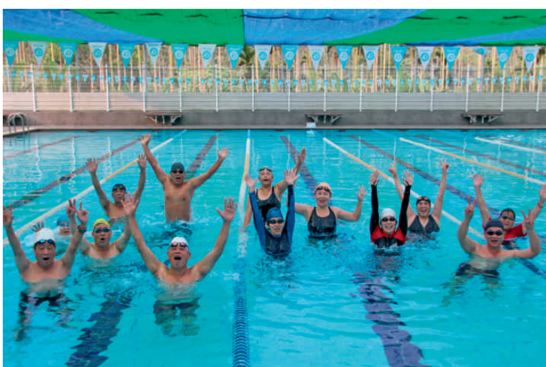
早泳會人馬強強滾