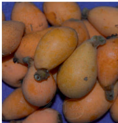
國姓鄉的枇杷鬆軟多汁是好吃。

今年雨水少，結果率高，甜度也高，雖然果粒較小，卻比往昔要甜很多，清明之前是枇杷的盛產期，若要享用需趁現在。