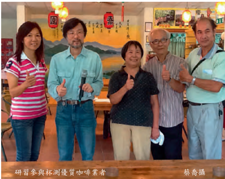
研習參與杯測優質咖啡業者

能有瑕疵豆、酸豆，乾淨度好，不能有雜味，如木質，土腥，臭穀物，酸敗味……最喜花香，柑橘香，水蜜桃味。此次研習韓老師帶了瓜地馬拉藝妓，依索匹亞 Aramo，哥倫比亞 Huila Catura，巴拿馬斐翠莊園 Es07 Leon Geisha，阿里山咖啡，東山咖啡，與 13 支國姓咖啡分三輪作杯測。指導同學在杯測前最好不要吃東西，增加敏銳度。感冒妨礙鼻子嗅覺，不宜參與杯測。杯測咖啡時從聞乾香、濕香，澀渣，啜吸，善用鼻前與鼻後 (口腔後) 嗅覺判斷香味。如何運用嗅覺、味覺、觸覺與口感。從咖啡汽化、液化、觸覺，體驗咖啡的香 (乾香，溼香) 辨別水溶性滋味 (如酸、甜、苦、鹹)。咖啡的香氣有 80% 會揮發掉，聞咖啡比喝咖啡的快感多。咖啡的苦有悅口苦，即苦香，死苦 (負面，瑕疵豆造成)。在三輪杯測 21 品咖啡中，夾雜進口豆精品與本土豆，從 Geisha, Catura, 依索匹亞咖啡，發出特殊香味，甘蔗、柑橘，冰其淋……香味中互相討論，使每一位同學瞭解咖啡評鑑與得分扣分的要點。在下午杯測練習時體驗咖啡的優劣，也喝多種一磅售價數百美元的珍貴的極品咖啡，這幾天教師精彩演出，精湛的課程，學員均呼稱最有價值的研習。