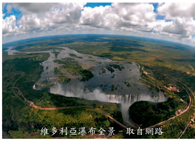
維多利亞瀑布全景