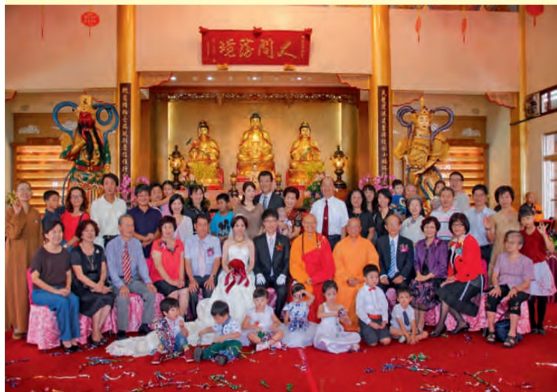
新人、雙方父母、親友與心定和尚、慧龍和尚在大雄寶殿前合影

雙方父母及親友 100 多人參加這項別開生面的結婚儀式，並齊唱佛化婚禮祝福歌，祝福這對新人「龍鳳花燭裏 永成連理枝」。中部地區佛光會會員 200 多人前來參加婚宴為新郎、新娘祝福。（文：緒天）