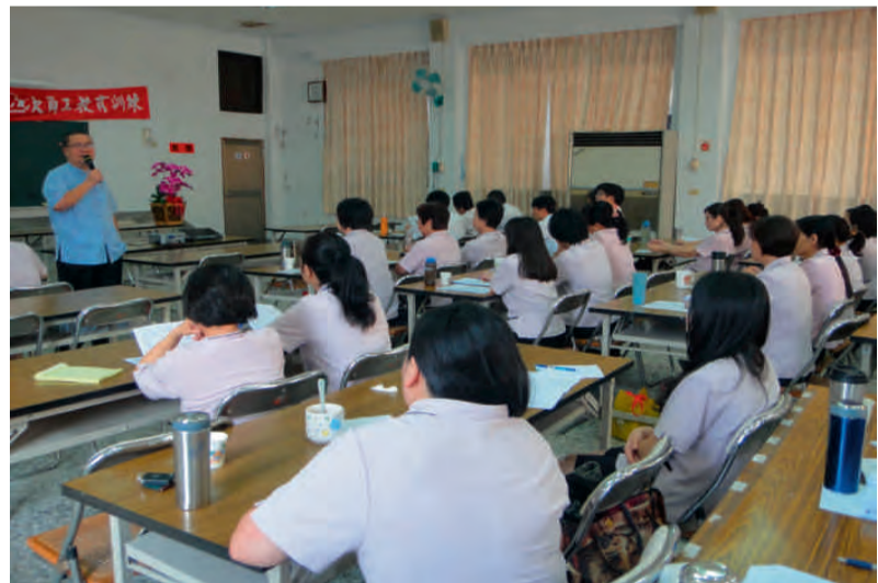
鄉農會員工教育訓練

節人事費用：由各股部負責清掃周遭環境，有煥然一新乾淨的辦公空間。五、員工午餐佳餚上桌：用人唯才，挑選專業員工烹飪，吃得健康，使員工精神抖擻，提供更優質服務。 人云：路不轉人轉，轉個念頭奇蹟綻放，在有企圖心、有創意、有行動力的總幹事領導下，相信再創國姓鄉農會奇蹟，是指日可待的。