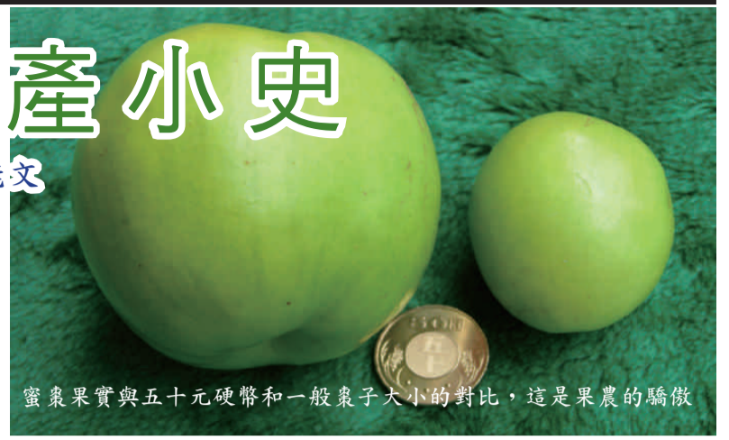
蜜棗果實與五十元硬幣和一般棗子大小的對比，這是果農的驕傲

因為蜜棗受天候影響很大，且家中人力有限，所以在生產策略上重質不重量。每年用活菌發酵的有機肥來種植，將不同品系的雄、雌花朵配對（目前較受市場歡迎的有雪密、中葉、三木），生產優質的果粒，再加上燈照來調節產期（約在11月底到次年2月中），可以比一般市場早20天收成，獲取較好的價格。依市場行情起落，目前每年約可以收入60-90萬元。 目前的蜜棗果農的生產組