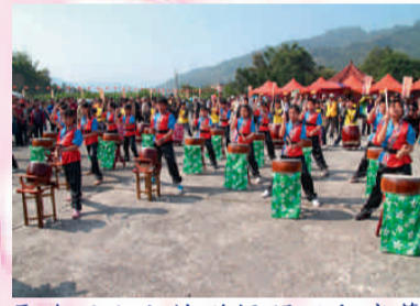
長流國小太鼓隊揭開活動序幕