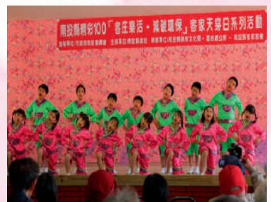
國姓國小歌舞表演