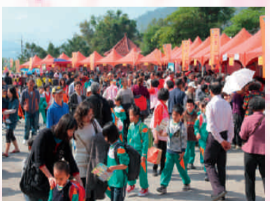
參與活動人潮滾滾