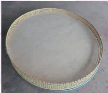
盛裝甜糕的特大的竹蔑炊簍