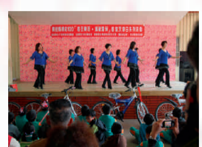
魚池客家協會表演細妹恁親