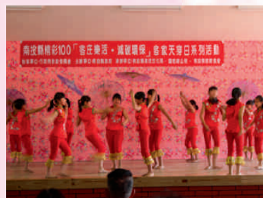
北港國小舞蹈表演