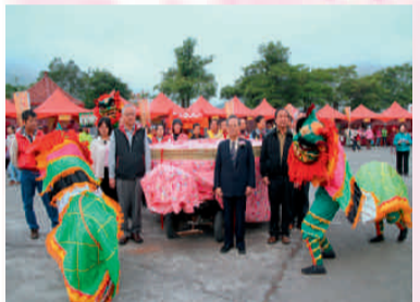
史港國小獅陣引千斤大甜糕祭拜女媧娘娘

本次活動人潮僅次於搶成功活動。近年來，本鄉各項活動已漸受各界重視，而行政院客委會亦將國姓鄉列為南投縣唯一「客家文化重點發展區」。國姓鄉在地理、農產及文化方面，比起其他鄉鎮有其特色及獨特性，也希望藉此活動讓國姓之名打開來，而吸引更多的遊客進來。