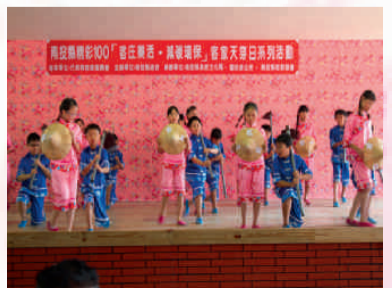
長流國小舞蹈表演