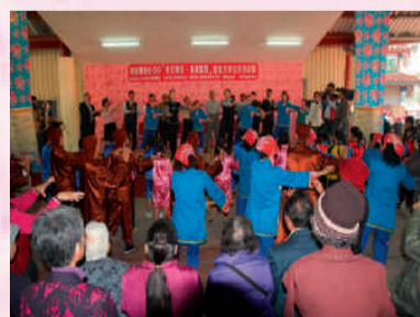
長官來賓與眾共舞客家世界