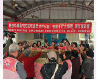
大甜糕做好了大家高聲歡呼