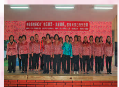
國姓客家協會演唱客家歌謠