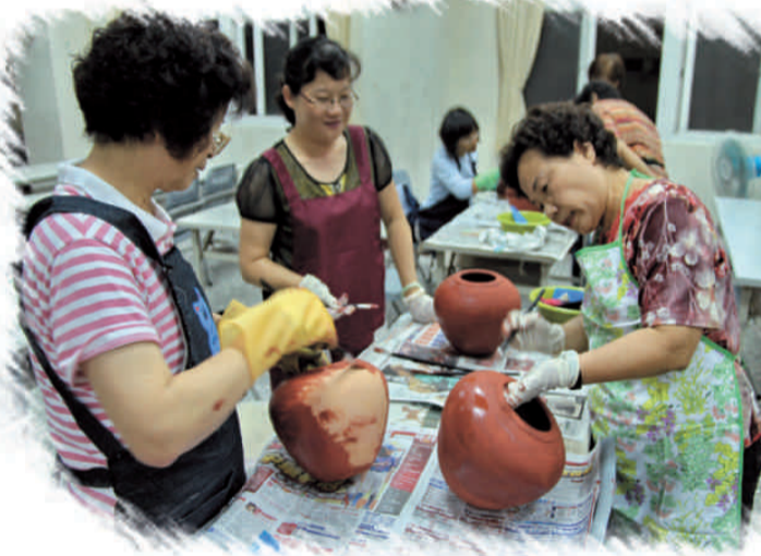
國姓社區活動中心漆藝研習上漆基本製作

如何拓展漆藝行銷市場，提昇漆樹的附加價值，為本鄉推動漆藝文化產業的終極目標。鑒於經濟發展必然提昇消費能力，漆藝市場已隱然再現，培育漆藝人才製作技能與作品藝術水準，為當前重要工作項目，國姓國中與國小已分別辦理漆藝DIY課程，另邀集有志學習漆藝技藝鄉親16人，每週二、四晚間在國姓社區活動中心，研習漆藝製作基本技法一〇〇小時，預定十一月「搶成功」客家文化活動時展示成果作品。