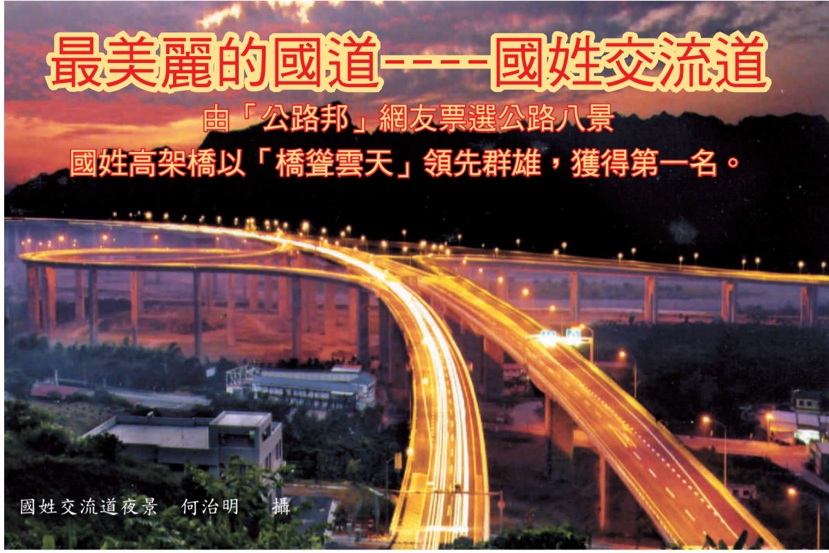
國姓交流道夜景

行，進入山區桃花源，被喻為是強調生態的第三代高速公路。以不破壞沿線動物、昆蟲、魚類的棲息環境為前提，重視生態環保，希望人類用謙卑的心情，讓生物能共生在該片土地上。車過可居高臨下飽覽烏溪河谷、九九峰絕美的風光，交流道線形優美的匝環道，高聳墩柱為當地特殊景觀地標。 坪林高架道路旁沿線九九峰環繞，九二一地震後山頂青翠山峰，山林剝落，山巒重疊、層次鮮明，東草屯交流道側面山壁，順向坡土石崩塌傾瀉河床，逆向坡猶然聳立，是地質研究的最佳教材。過了坪林國道沿線，綠意盎然群山環抱，白雲綠丘，筆直國道穿堂而過，黃廊隧道2463米長，燈火通明，斗山隧道前可以遠眺中央山脈，冬來時節可賞合歡瑞雪。