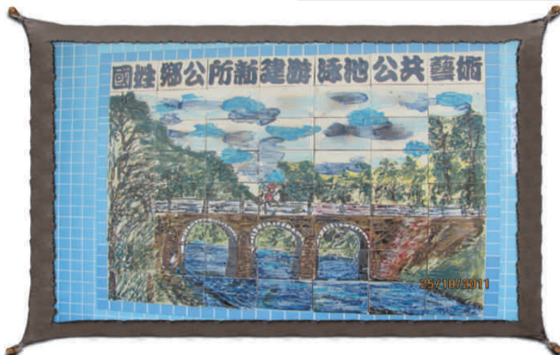
上圖：林鄉長製作公共藝術標誌 下圖：兒童游泳池