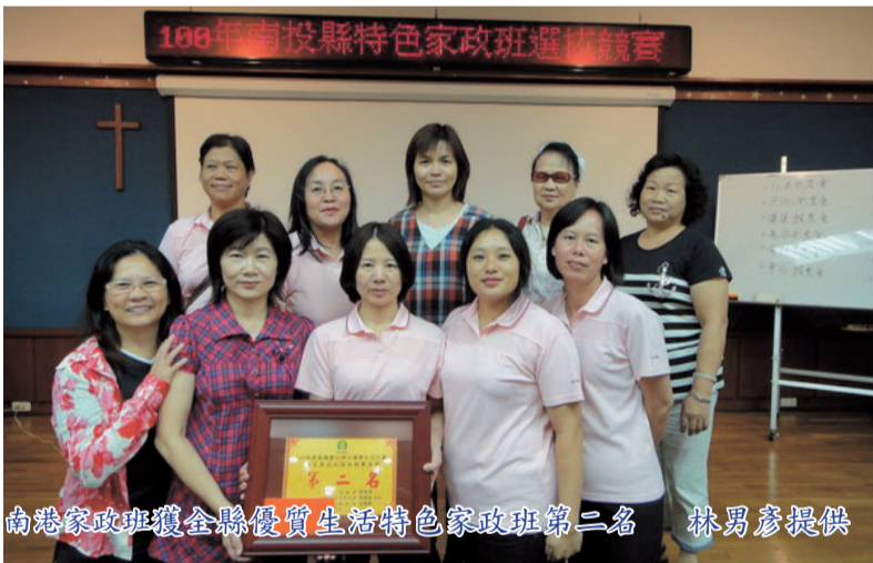
南港家政班獲全縣優質生活特色家政班第二名

經驗分享。隨後全體班員合唱一首道盡客家莊養鹿人家生活樂趣的民謠：「南港之歌」。整個受評審項目富創意且生動，普獲大會評審委員們高度肯定，最後評定為全縣第二名優質生活特色家政班，獲頒獎勵金參仟元及獎牌一只。好消息傳回，南港社區發展協會全體幹部及居民均表與有榮焉。