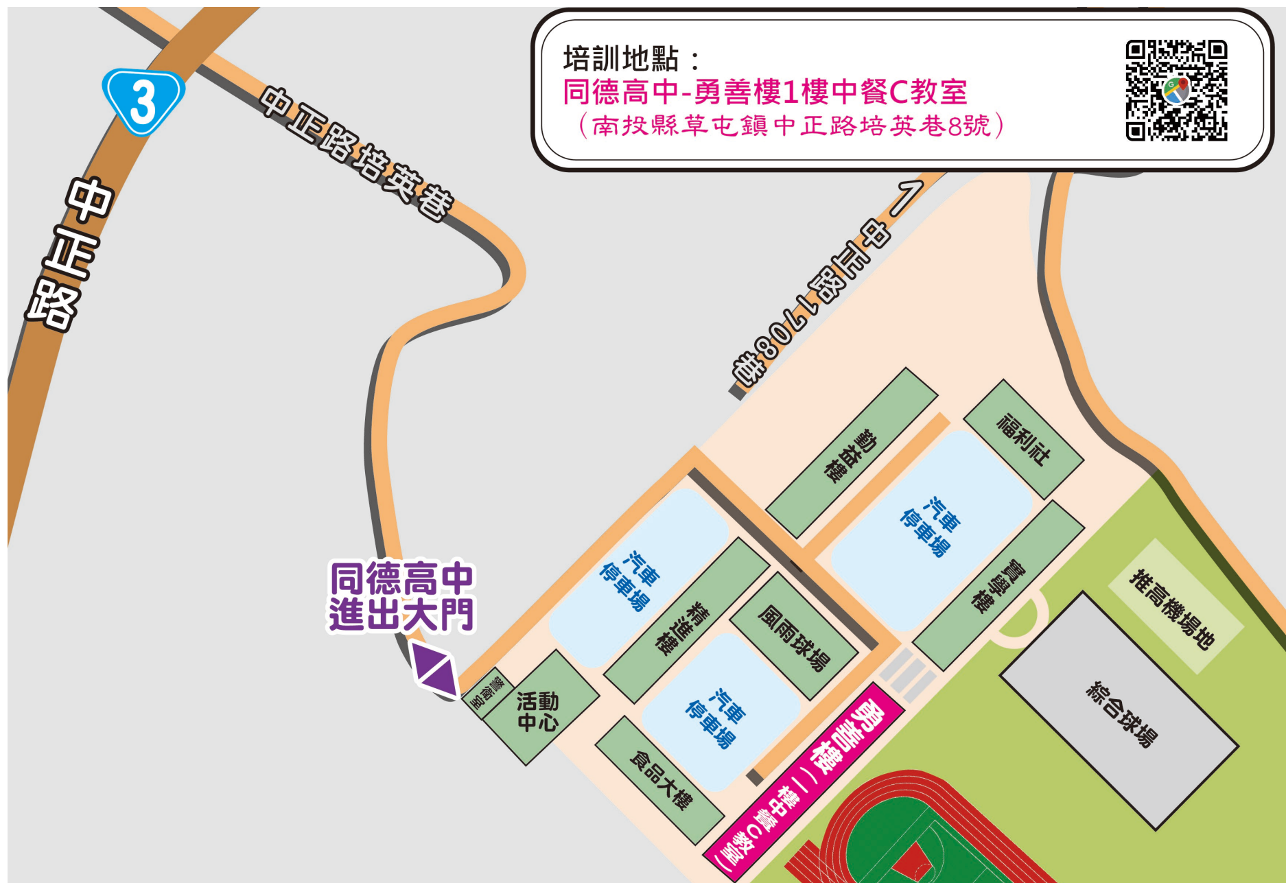
附件、同德高中校園平面圖